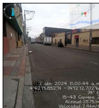
Ilustración 2. Evidencias recorrido